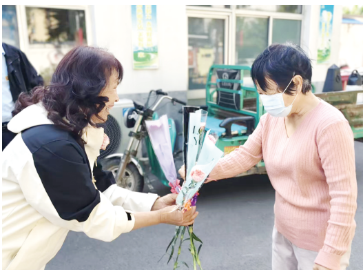
5月10日,奎文区北苑街道丁家社区联动辖区小区物业,为辖区的母亲送上一份温暖的节日惊喜。工作人员将鲜花逐一送到身为母亲的居民手中,每递出一枝鲜花,送上一声祝福,用最质朴的方式表达对她们的敬意与关爱。 本报记者 郭超