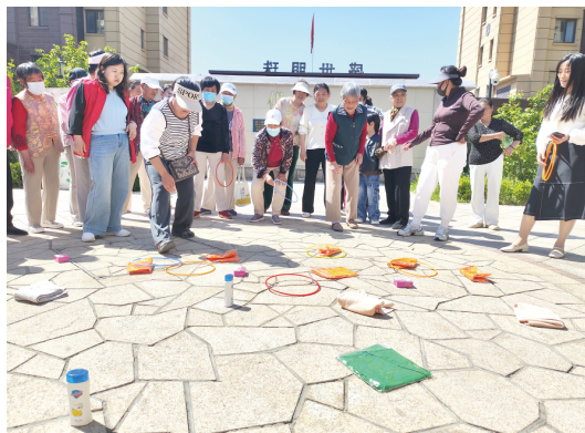
为丰富居民精神文化生活,5月10日,奎文区廿里堡街道凤凰街社区组织辖区的妈妈们举办趣味运动会。社区工作人员提前布置好场地,大家有序排队、兴致满满,欢声笑语不断。另外,社区工作人员还开展禁毒、非法集资等方面宣传,并讲解相关知识。 本报记者 王来臣 通讯员 庄萌萌