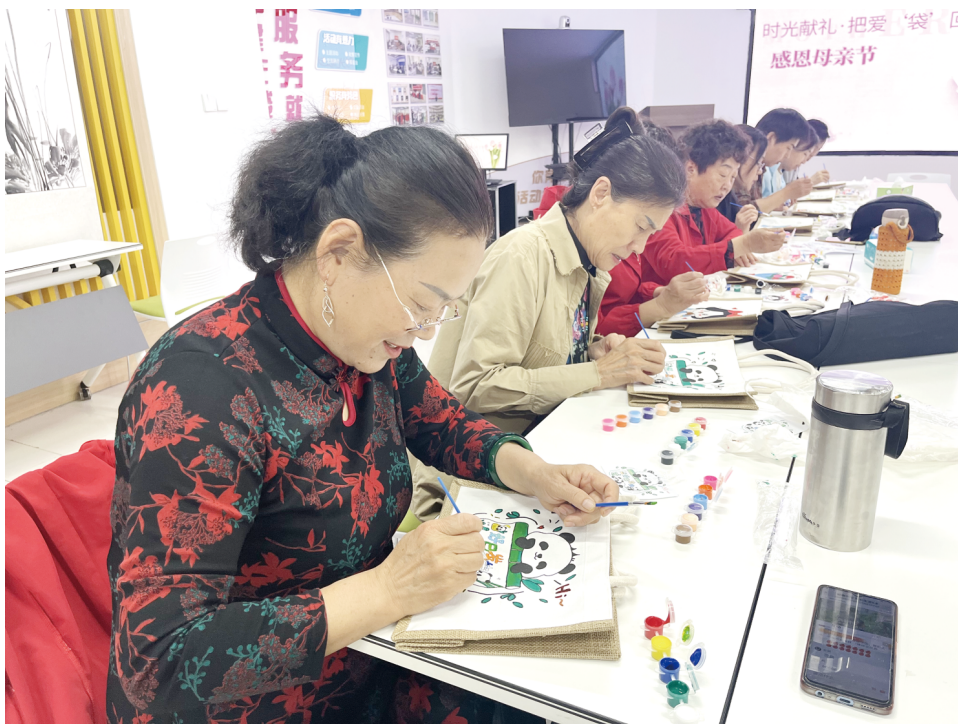
5月10日,奎文区北苑街道金鼎社区开展手工包制作活动,邀请辖区妈妈们相聚一堂,用指尖传递心底的爱意。现场氛围轻松舒缓、暖意融融,看着亲手制作的作品,大家脸上洋溢着满足的笑容。此次活动不仅让妈妈们在动手实践中放松身心、陶冶情操,更收获了一份独一无二的礼物。 本报记者 王来臣