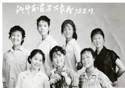
1978年8月23日的毕业生合影