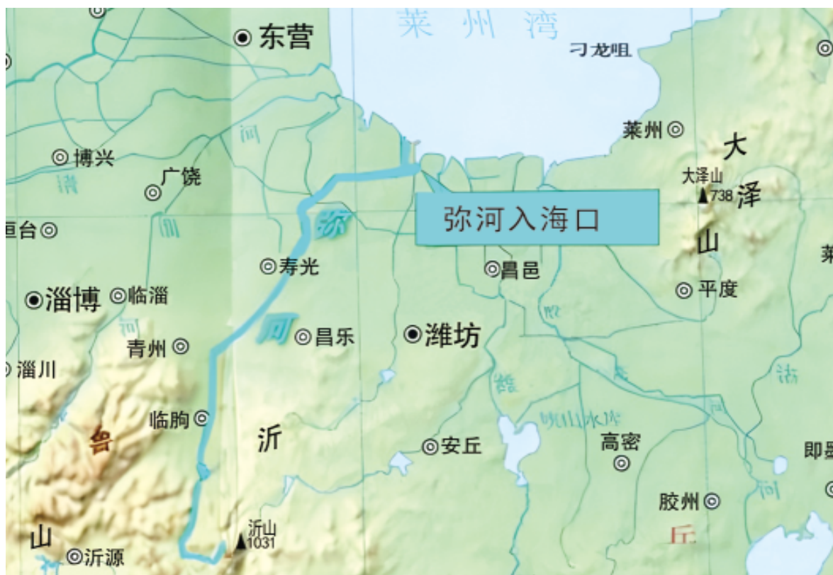
弥河全景图(资料图片)