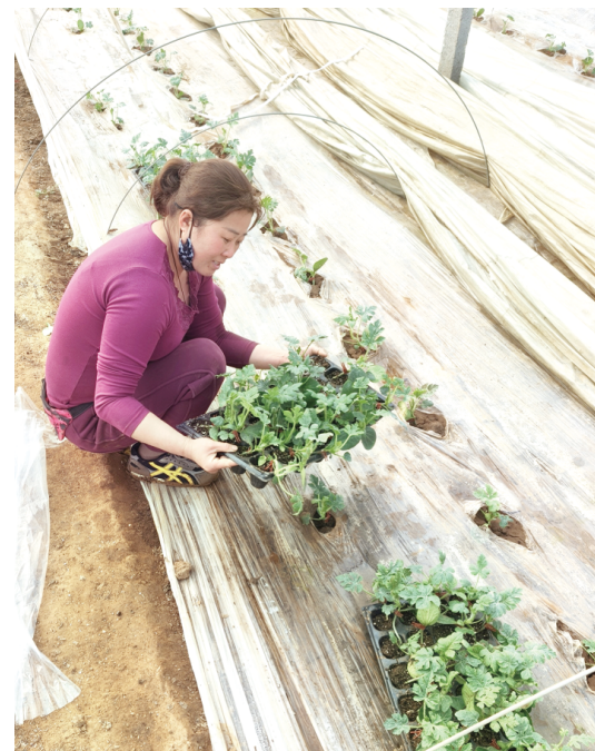
瓜农正在栽种瓜苗。

人勤春来早，瓜农们用勤劳的双手，在春天播下希望的种子，也播撒着对美好生活的向往。随着当地西瓜产业的不断发展壮大，当地瓜农的“钱袋子”不仅鼓了起来，也为乡村振兴注入新的活力。