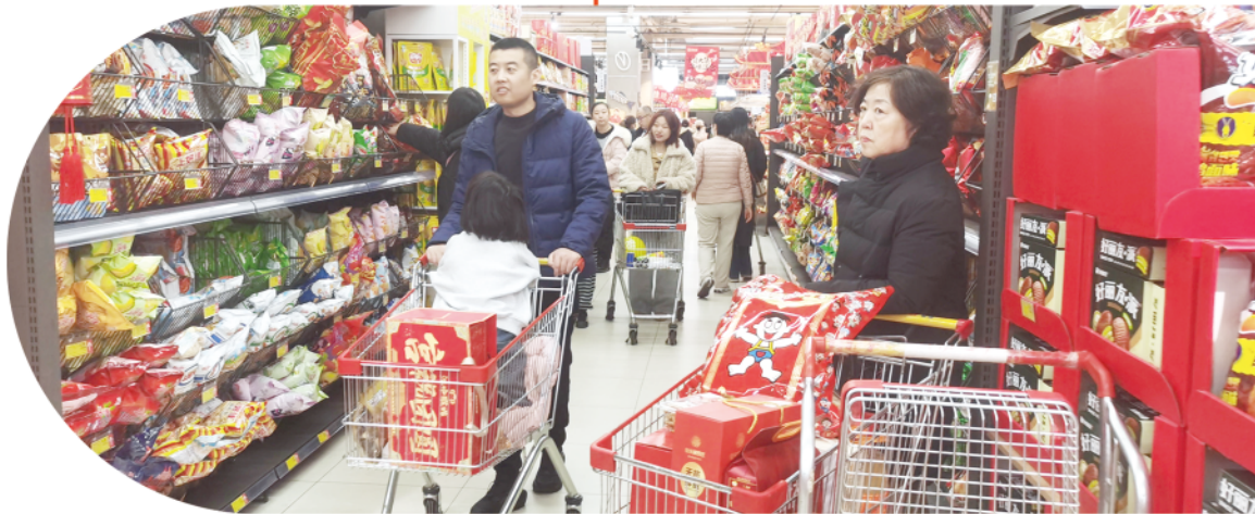
市民在佳乐家超市新华店购物。

在采访中，不少受访者表示，“拼豆”不仅可以享受解压的手作时光，同时也可以作为一份春节礼物送给亲友。一颗颗小豆子拼出的，不仅是妙趣横生的图案，更为传统节日增添了充满创意与温度的现代亮色，营造出浓厚的新春氛围。