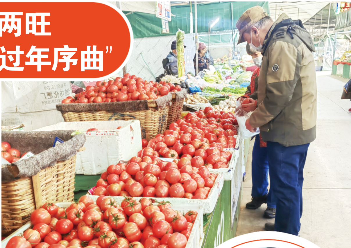
市场上蔬菜供应充足。

一名商户对记者说，他们提前准备了充足的货源，满足广大消费者春节期间的消费需求。近段时间，市场上客流逐渐增多，一派热闹而繁忙的景象，大家忙并快乐着。