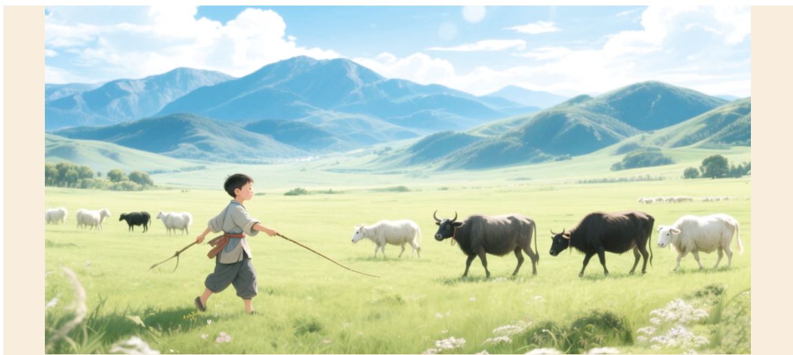
少康稍大便放牧牛羊。