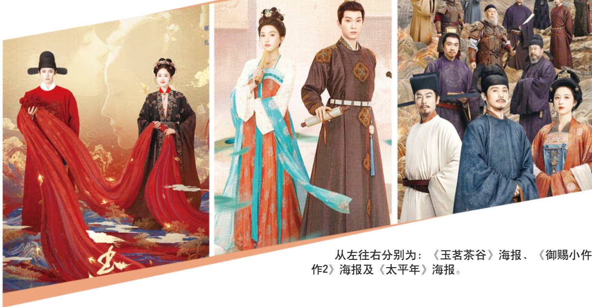
从左往右分别为:《玉茗茶谷》海报、《御赐小仵作2》海报及《太平年》海报。