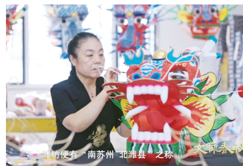
《文脉春秋·潍坊》播出画面

本报讯(记者 马宇琪)1月30日18时20分,《文脉春秋·潍坊》在中央广播电视总台综合频道(CCTV-1)播出。