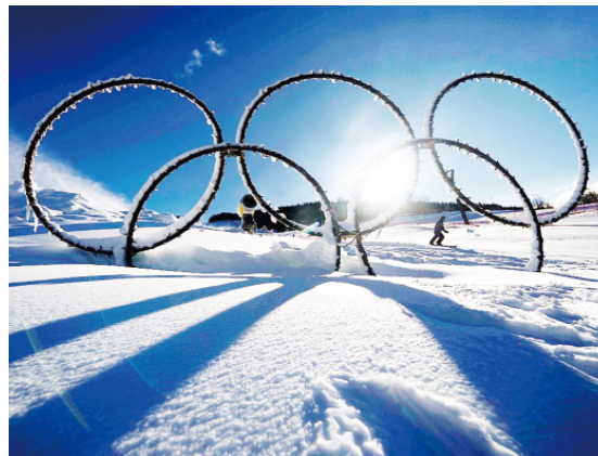
位于意大利博尔米奥的冬奥会高山滑雪和登山滑雪项目场地斯泰尔维奥滑雪中心,雪地中展示着奥运五环。

不过,一些环保人士也对使用人造雪表达了担忧。他们认为,制造人造雪耗费的水和电力资源实在太太大,且为人造雪系统建设水库也会对周边生态系统产生负面影响。但支持者认为,这些问题可以靠使用可再生能源缓解,更何况冬奥会还能拉动经济,为当地提供数千个工作岗位。