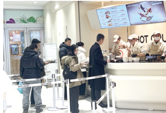
顾客在城区一家面包店排队购买。

本报讯(记者 马宇琪)近日,记者走访城区多家面包店发现,曾经几元钱就能买到的面包,如今价格普遍跃升至20元以上;一块普通尺寸的蛋糕售价也多在35元以上。令人意外的是,这些烘焙产品涨价后并未滞销,反而成为不少店铺的销量担当,尤其受到年轻消费者的青睐。