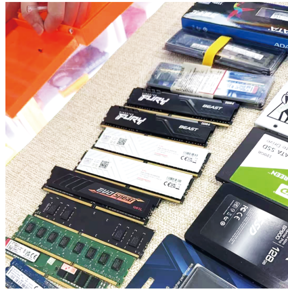
孙先生店内在售的内存条。

内存条价格狂飙,零售端并未出现明显囤货冲动,这届网友表现十分淡定。网友“百姓之见”表示:“现在是高科技时代,科技产品更新换代非常快,今天是黄金价,明天可能就成了白菜价。”网友“懒的理你啊啊”则调侃:“挺好的,继续涨,这下我可以彻底不玩游戏了。”