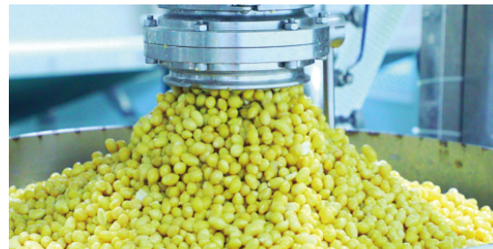
金灿灿的黄豆即将被磨成豆浆。

如今的“傅家豆腐”不仅延续了“原料纯净、口味正宗”的百年口碑,更通过产业创新成为乡村振兴的重点产业,被纳入潍坊市“一村一品”示范项目。通过这一项目,傅家村及周边农户将深度参与大豆种植、加工生产、销售配送的全产业链条,进一步巩固和提升“傅家豆腐”的村级特色品牌地位,带动村民实现共同富裕。