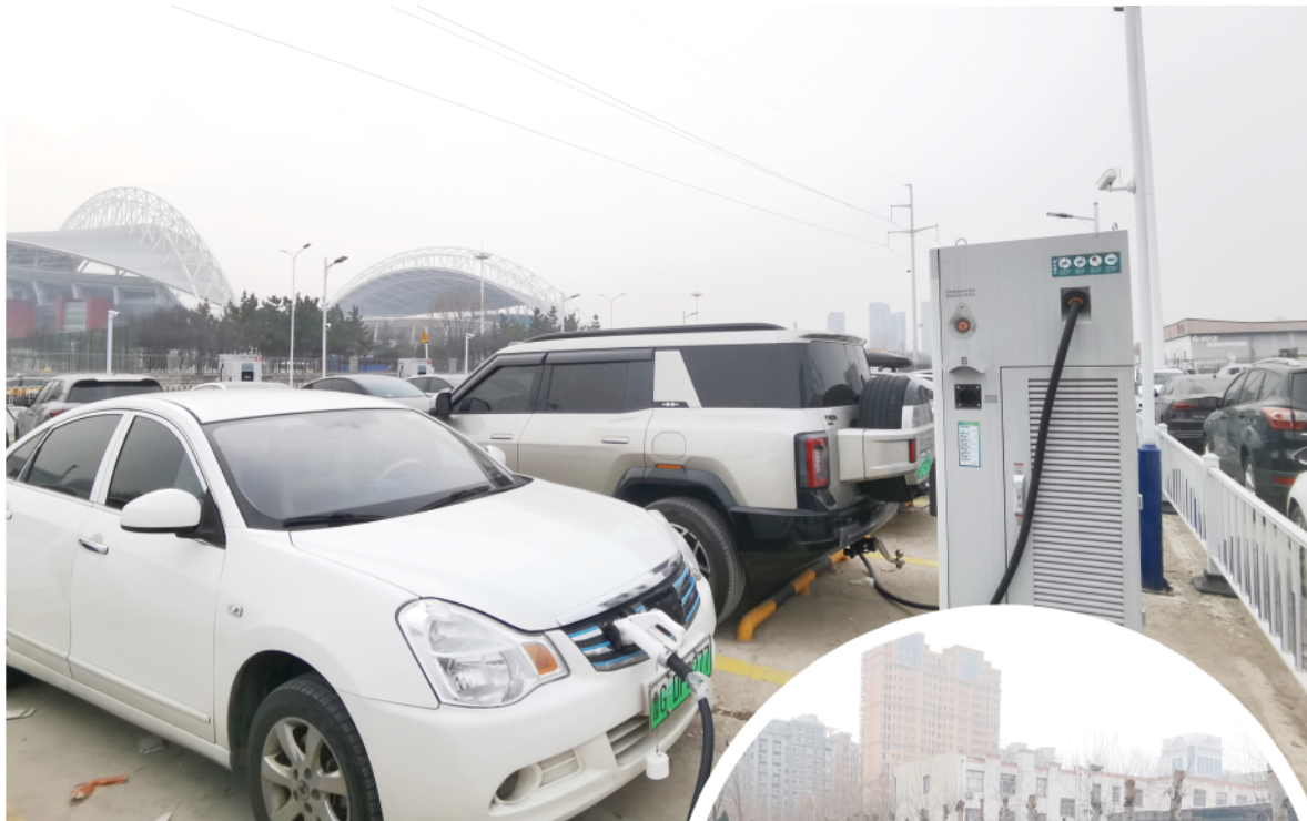
在潍城区卧龙西街公共充电站内，车辆正在充电。