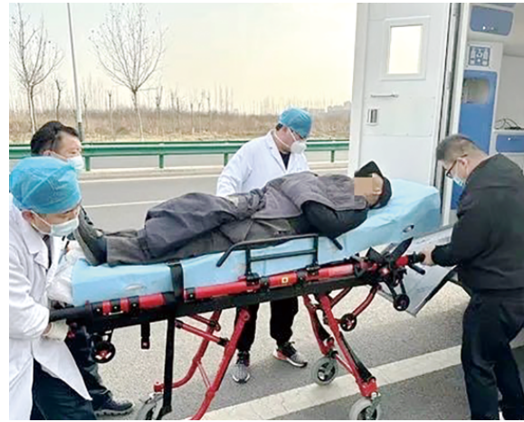
患者被急救医护人员抬上5G+智慧救护车。(资料图)

从“孤立施救”到“全域协同”，5G智慧急救体系正以科技之力，重新定义生命的守护方式。这不仅是医疗模式的革新，更是对“人民至上、生命至上”理念的深刻践行。