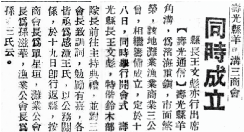
1939年3月26日《晨报》关于羊角沟伪商会等成立的报道