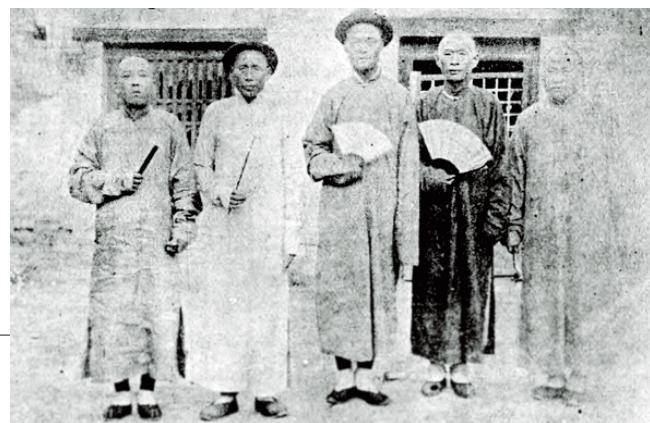
羊角沟盐户与老板合影。