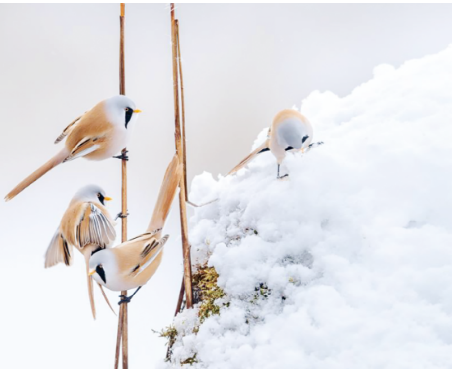
金秋10月，黑龙江省大庆市龙凤湿地自然保护区第一场雪下了两天，湿地精灵文须雀在芦苇荡冰雪中觅食、嬉戏。