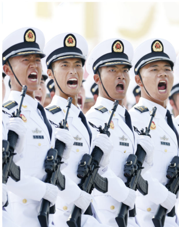
海军方队接受检阅。

2022年10月，解放军仪仗大队与解放军军乐团合并整编为中国人民解放军仪仗司礼大队，成为唯一一支担负国家级仪仗司礼任务的部队。