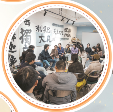
▲分享会现场很热烈。