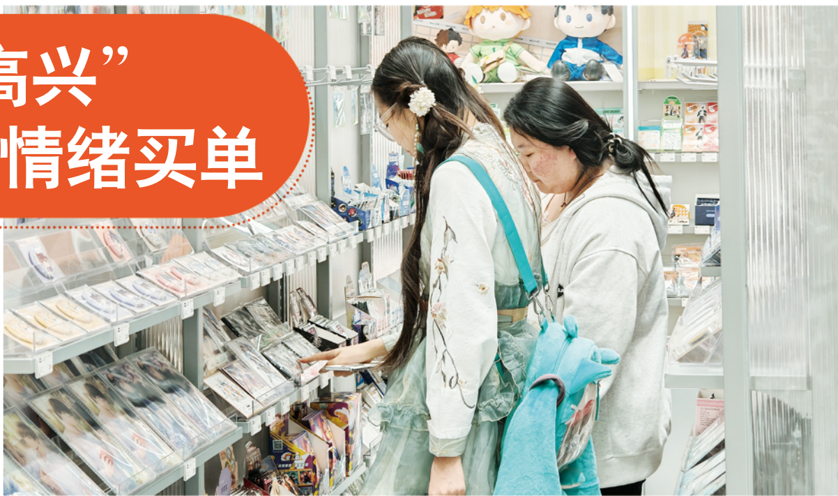
在城区一潮玩商店，年轻顾客在选购“谷子”。

“悦己情绪”是当前“谷子经济”的核心驱动力。所谓“谷子”，是由英文“goods”音译而来，指代一切漫画、动画、游戏等版权作品的周边商品，潍坊不少“谷子店”成为年轻消费者的新宠。3月12日，记者在城区谷德广场内看到，一家“谷子店”内