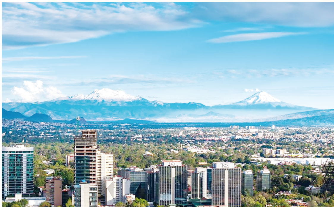
墨西哥的波波卡特佩特火山和伊斯塔西瓦特尔火山(图左)以墨西哥阿兹特克神话中的一对恋人的名字命名,两者山体相连,被人们称为墨西哥的“情侣”火山。伊斯塔西瓦特尔火山海拔5230米,全景像仰卧的女性,当地人也称其为“睡美人山”。波波卡特佩特火山海拔5426米,位于墨西哥城东南大约65公里处,是世界上最活跃的火山之一。