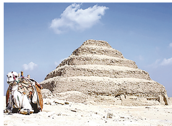
本报综合新华社等报道

水流自大坝顺流而下,经过一系列下水管道,在金字塔下方28米的地方将水输送到水力升降机。通过水上下浮动,古埃及人把沉重的建筑材料,像“火山喷发”时一样,送到了金字塔的最高处。