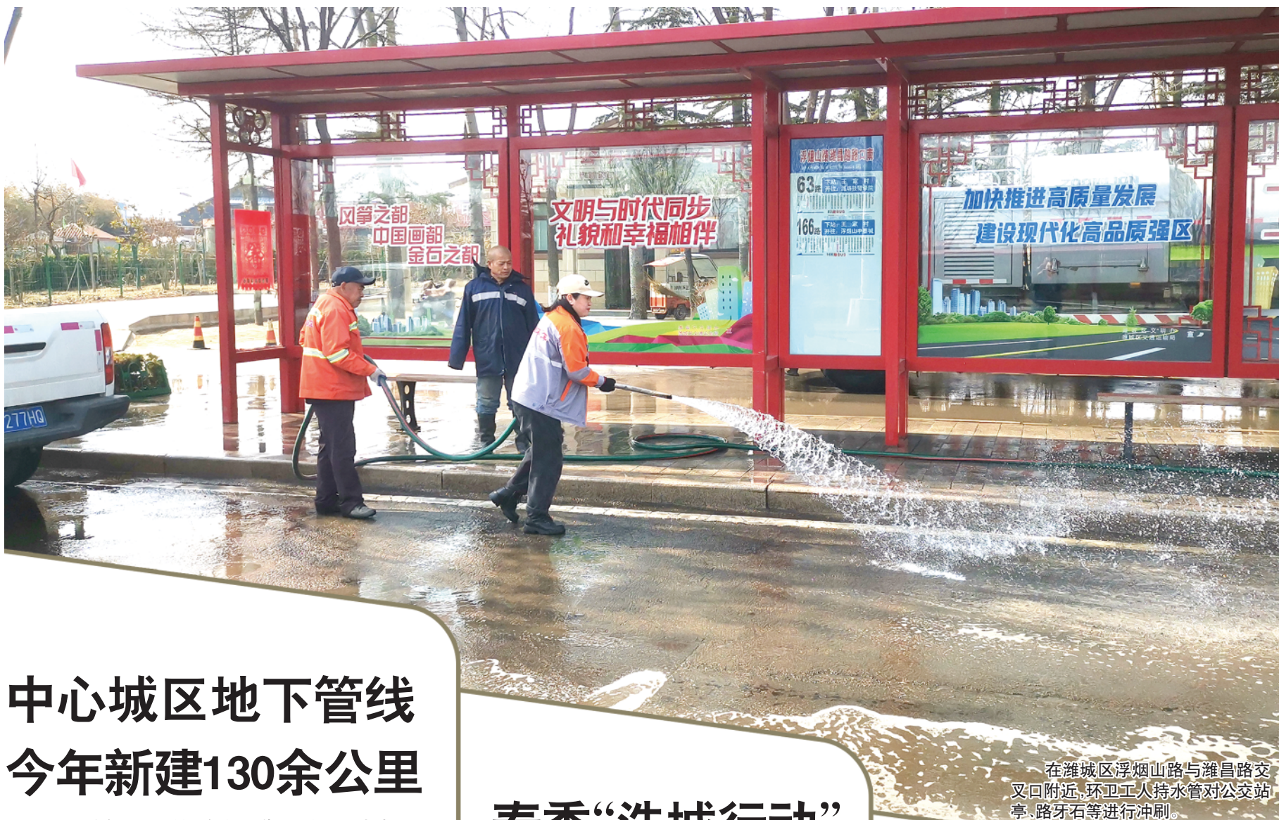
在潍城区浮烟山路与潍昌路交叉路附近,环卫工人持水管对公交站亭、路牙石等进行冲刷。