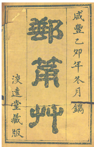
杨玉堂著作《邮笥草》。