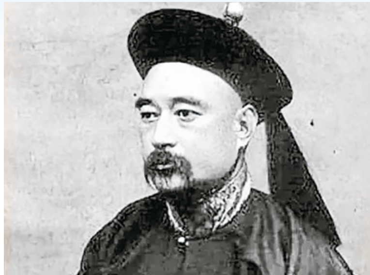
被刺杀的安徽巡抚、庆亲王奕劻的女婿恩铭