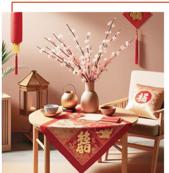
红色的桌旗增添喜庆气氛。