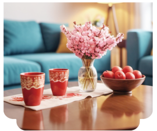
客厅的桌子上摆放着红色杯子。