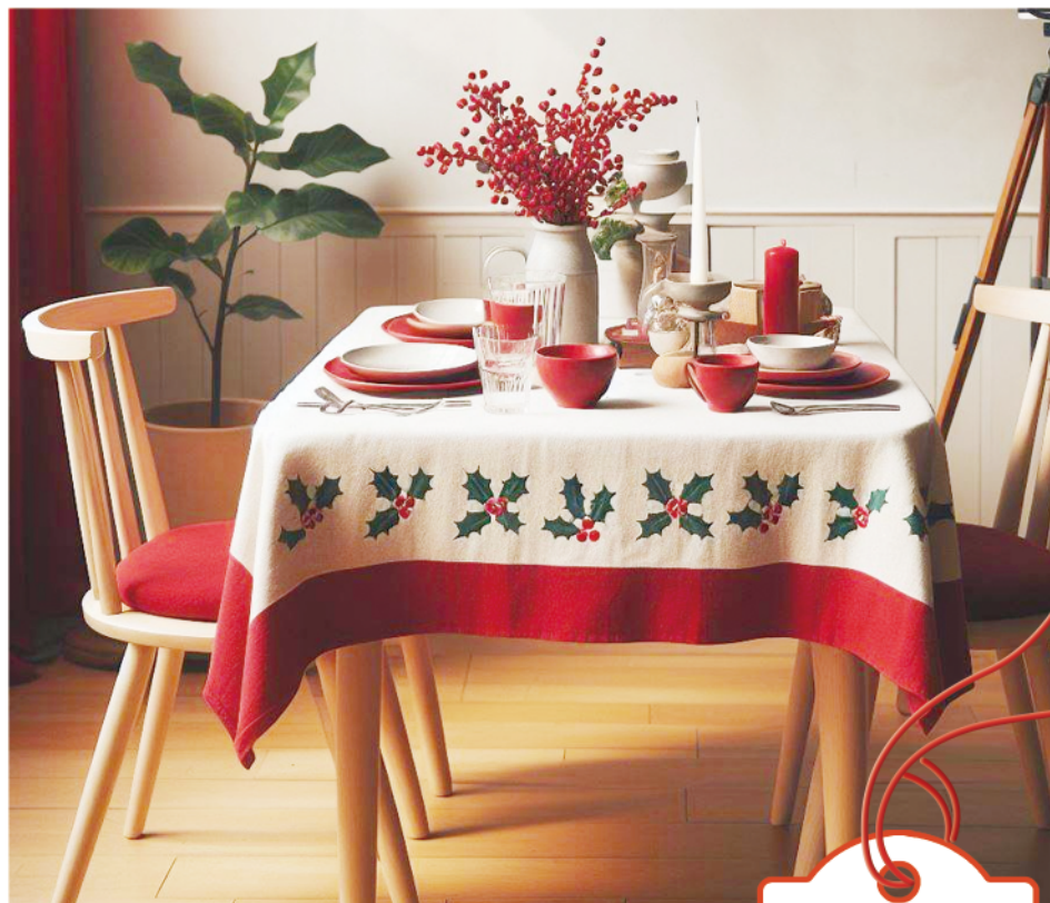
餐桌上摆着红冬青,桌布也是红冬青图案。