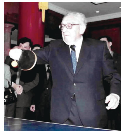
2001年3月18日,基辛格在中国人民对外友好协会纪念中美“乒乓外交”30周年的招待会开始前挥拍助兴。