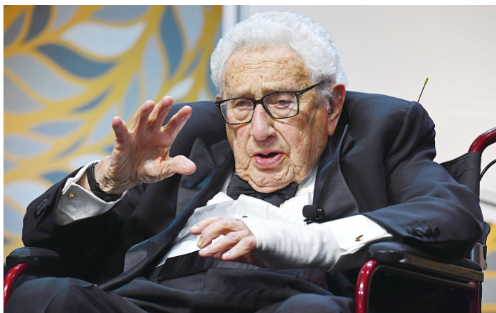
当地时间2023年10月24日,基辛格在纽约举行的中美关系全国委员会年度颁奖晚宴上讲话。

基辛格著有《核武器与对外政策》《白宫岁月》《动乱年代》《论中国》等关于国际关系和国际政治的书籍。在其卸任公职后,他还经常接受美国两党总统和外国领导人的咨询。