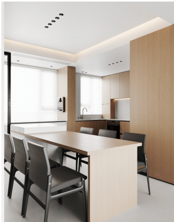
餐桌和厨房色系统一。