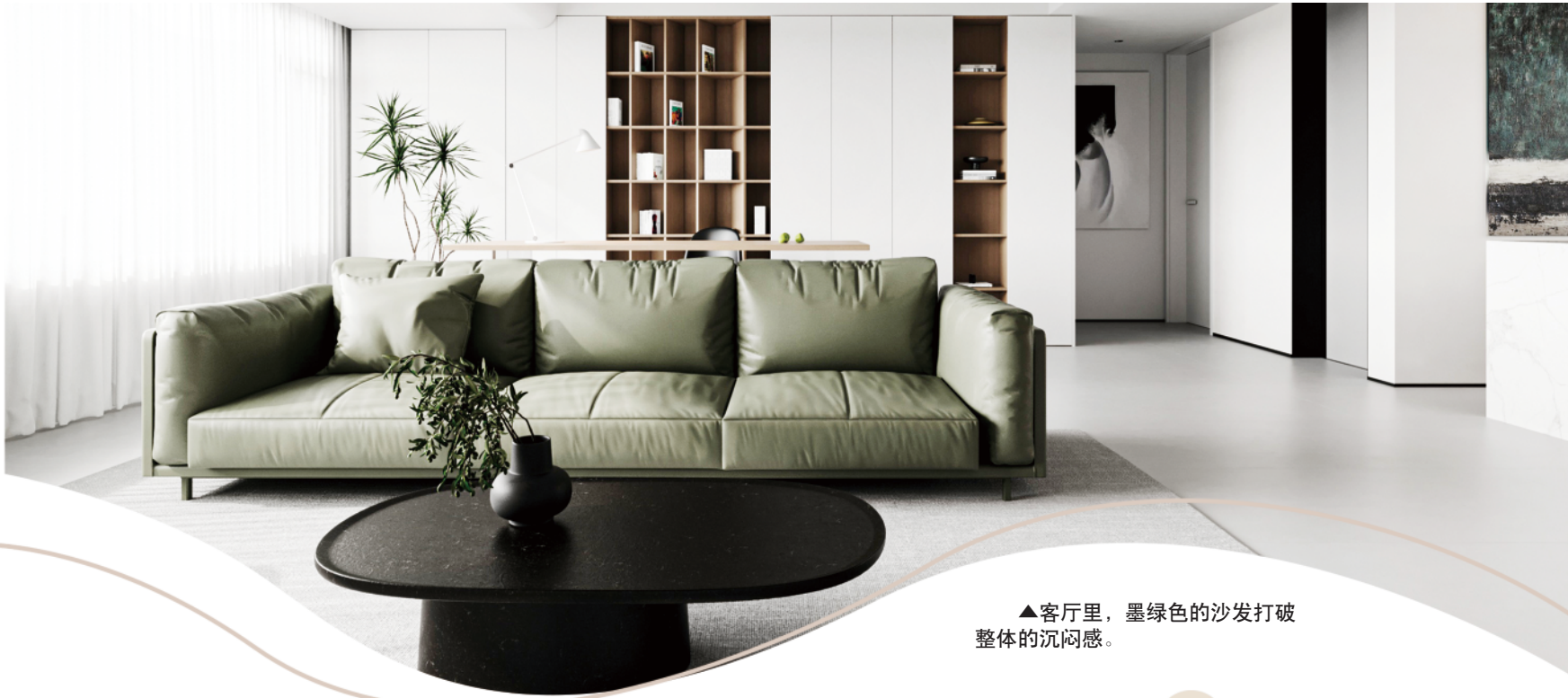
▲客厅里，墨绿色的沙发打破整体的沉闷感。