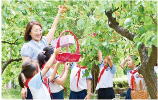
师生劳动采摘收获快乐