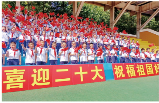
学校开展“喜迎二十大 祝福祖国好”活动

青州市旗城教育集团旗城小学秉承“把孩子放在学校最中央”办学理念，以创办“美好教育”为核心，坚持以“立德树人”为总抓手，倡导“做学习的设计师，让学生的学习可见”，以内涵发展促品质提升，让学生核心素养落地，努力提升教育教学品质，各项工作再创新辉煌。